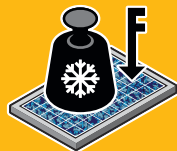
ROBUSTES UND NACHHALTIGES PRODUKTDESIGN