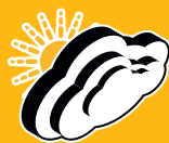
OPTIMALES SCHWACH- LICHTVERHALTEN